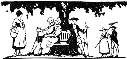
Pages d'autrefois LE REVENANT DU FAUBLANC