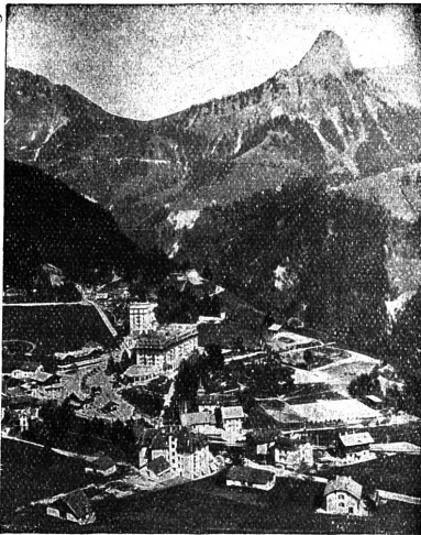
Les Avants et la Dent de Jaman

Chemin de fer électrique Montreux-Oberland bernois