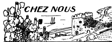
RIEN DE NOUVEAU SOUS LE SOLEIL

— Eh bien ! postule la place de concierge.