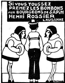
Rossier frères, succ.

Administration : Pré-du-Marché 11, Lausanne