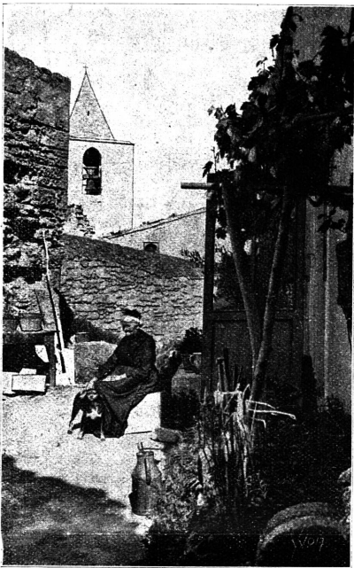
LES BAUX — Un coin du Vieux Village.

— Ces tonnerres de Méridionaux, il n'y en a point comme eux. C'est bien le cas de dire : « Poison de souleil ! ».