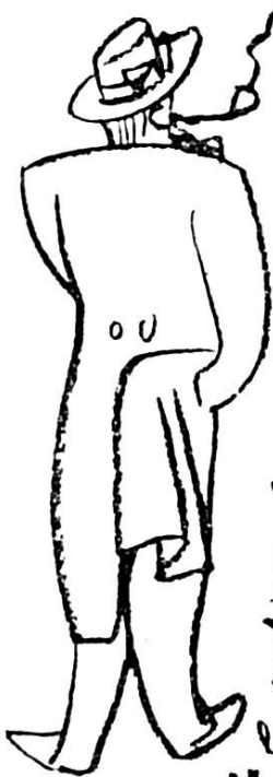
un pasteur de la nationale.