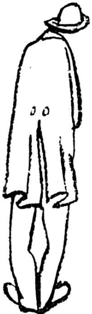
un pasteur libre