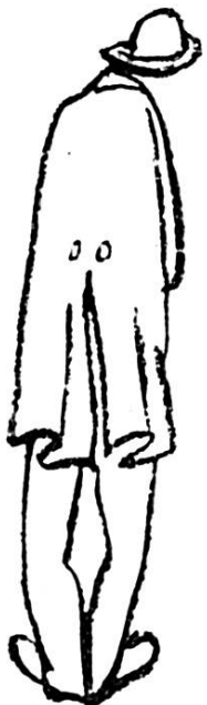
un pasteur libre