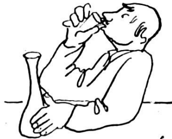
... Sa suite dans les idées