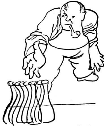
... Son esprit de décision, un coup de neuf.