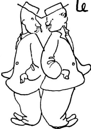
... Son calme en toutes circonstances.