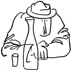
... Son sérieux à la veille des élections