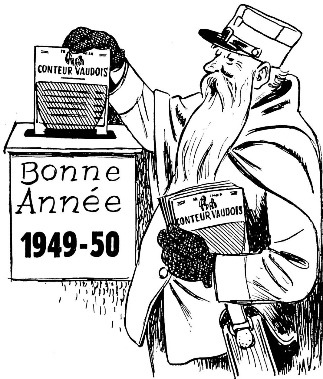
Un dessin de Marcel Vidoudez

Un cadeau pas cher et qui fait plaisir toute l'année !