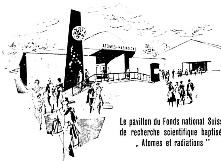
Le pavillon du Fonds national Suisse de recherche scientifique baptisé : „ Atomes et radiations ”

Enfin, les expositions de bétail, dans les nouvelles halles d'exposition que 1953 inaugurera, se succéderont, témoignant de l'effort de nos éleveurs. Une journée agricole sera célébrée le mercredi 16 septembre.