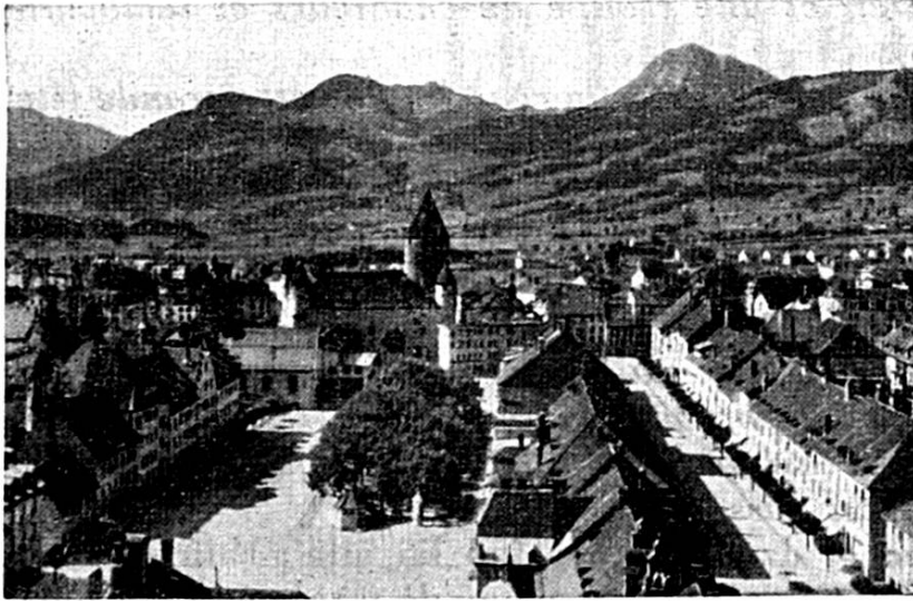
Vue de Bulle à vol d'oiseau.