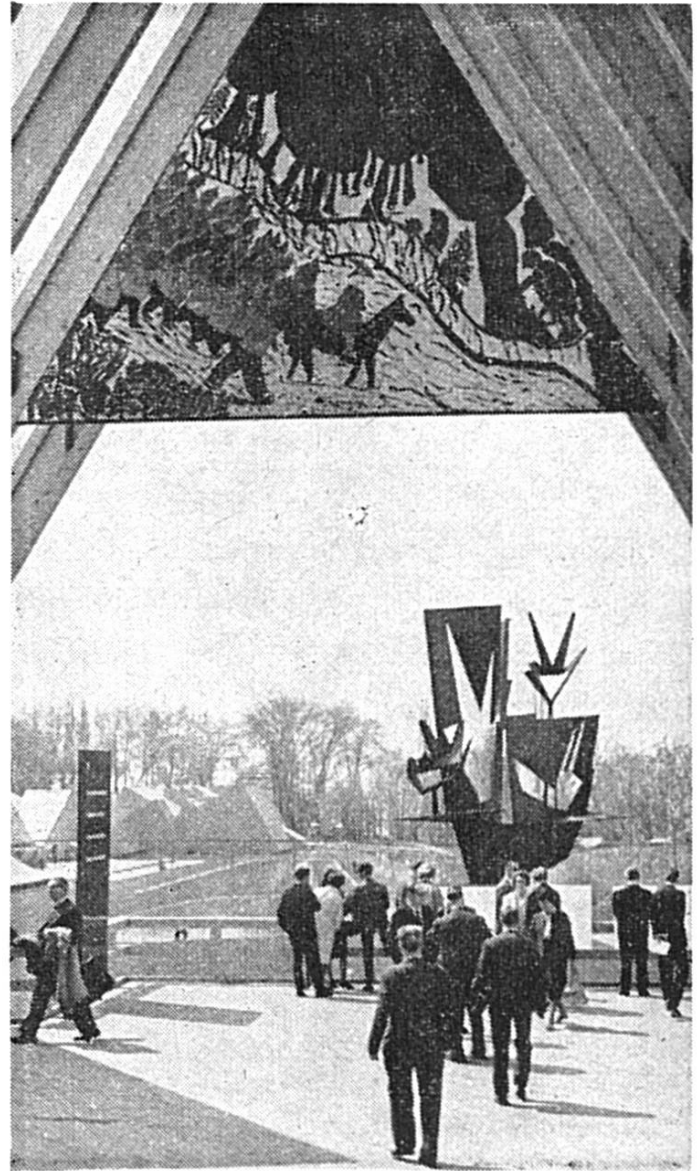
Dernière vision de l'« Expo 64 » : Le Serment des Trois Suisses! (FAL)

sentés.) Quant aux disques, leur exploitation commerciale (vente du solde, rééditions, créations éventuelles et publicité) va être confiée à une importante maison spécialisée que nous vous indiquerons en temps opportun. En attendant que soient signés les contrats, le soussigné reste à votre disposition pour vous envoyer le disque qui manque encore à votre collection ou que vous vous ferez un plaisir d'offrir à vos amis.