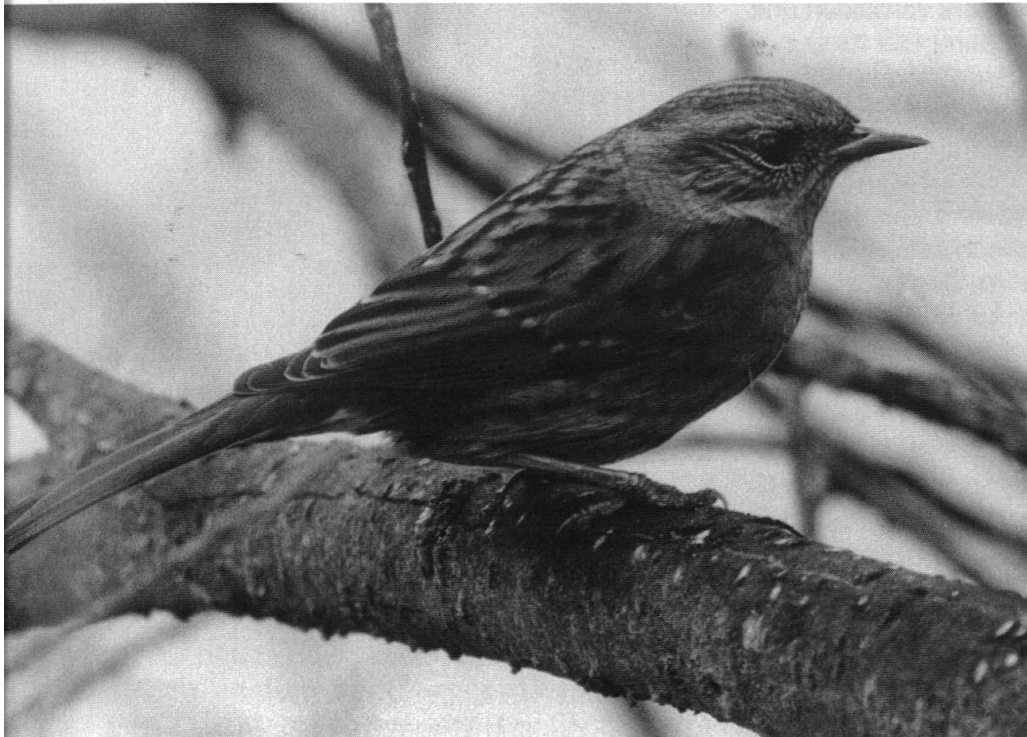
Die heimliche Heckenbraunelle wurde im ORNIS-SNP-Projekt mehrfach nachgewiesen.