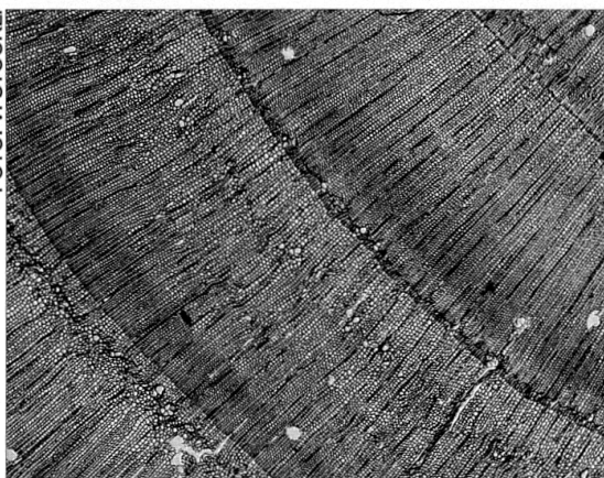
Abb. 1. Die Jahrringe 1909 bis 1911 einer Bergföhre vom Standort Stabelchod mit ihren für diese Jahre charakteristischen Frostringen (Pfeile).

ins Inntal (Hegi 1981). Wie andere Arten der Gattung Pinus ist sie lichtbedürftig. Bergföhren können Rohböden an Standorten besiedeln, die schlechte Bedingungen für das Baumwachstum bieten, wie Lawenbahnen, Felsen oder Schuttkegel (Brunies 1906). Als Pionierbaumart bildet die Bergföhre deshalb oft dichte und gleichaltrige Bestände.