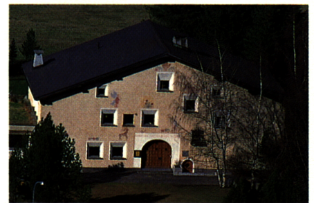
Das Nationalparkhaus in Zernez wurde 1968 eröffnet. Es wird jährlich von rund 20 000 Personen besucht. In den kommenden Jahren soll das Informationszentrum vollständig erneuert und erweitert werden.

Erklärtes Ziel ist es auch, das Nationalparkhaus ganzjährig offen zu halten. Dieses zusätzliche Angebot könnte insbesondere in Zernez touristische Impulse während der Wintersaison auslösen.