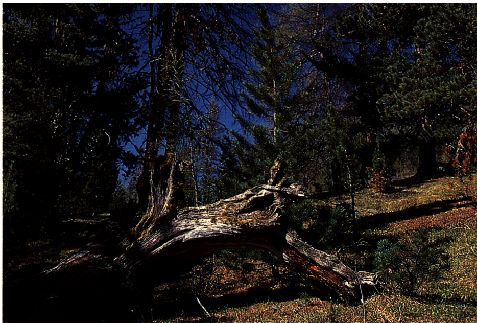
Der heutige Nationalpark besticht durch seine unberührte Naturlandschaft und seinen Reichtum an Huftieren wie Hirsche, Gamsen und Steinböcke.