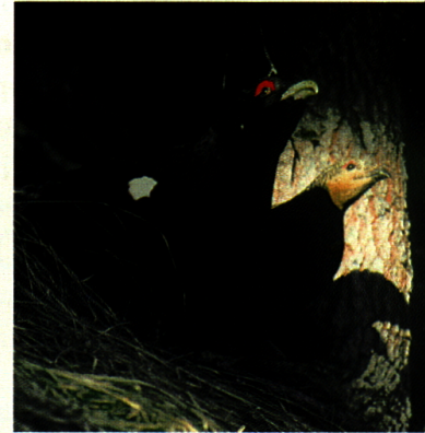
Hahn und Henne in Deckung vor einem Luftfeind

Chanel. Doch da die Ernährung der Hennen während der Zeit der Eiablage durch eine hohe Vielfalt gekennzeichnet ist und die ersten schneefreien, trockenen Stellen für die Nestanlage bevorzugt werden, kommt das Trupchuntal nur ausnahmsweise als Brutort in Frage. Die Hennen suchen deshalb, noch früher als die Hähne, entsprechend günstigere Gebiete in tieferen Lagen ausserhalb des Nationalparks auf. Doch bereits wenige Wochen später ist das Nahrungsangebot auch in der Val Trupchun günstig, sodass in der Nähe brütende Hennen gelegentlich auch die zur Aufzucht der Küken bevorzugten offenen Waldgebiete der linken Trupchunseite aufsuchen. Dort finden sie genügend Insekten,