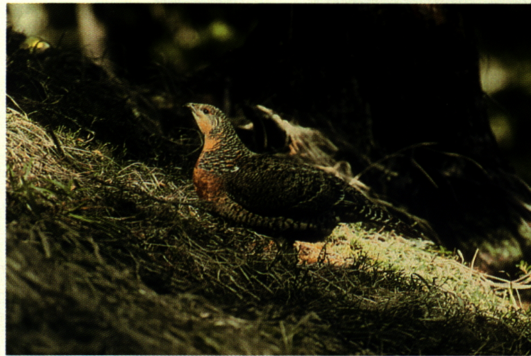
Auerhennen weisen eine unterschiedliche Zeichnung und Färbung der Hals- und Brustfedern auf.

Das Interesse am Auerhuhn hat in den letzten Jahren stark zugenommen. Die Forstwirtschaft ist heute weitgehend bereit, Massnahmen zur Verbesserung seines Lebensraumes zu treffen. Diese erfreuliche Entwicklung kann dieser Lebensgemeinschaft nur förderlich sein. Im Bewusstsein, dass dieses Biotop auch für uns Menschen «Leben» bedeutet und uns in vielfältiger Weise dient, sollte es uns leicht fallen, seine Bewohner zu schützen. Für das Auerhuhn gibt es keine Alternative.