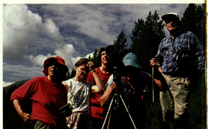
Tierbeobachtung ist eine der Hauptattraktionen des Nationalparks. Doch auch der Blick durchs Fernrohr will gelernt sein.