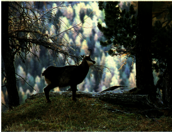
Dieser Gämsbock am Wegrand lässt sich durch die Wanderer nicht sonderlich beeindrucken.

entpuppen sich einige Kursteilnehmer zu wahren Kennern der Pflanzenwelt. Tricks und Spiele helfen auch Botanik-Anfängern, sich Name und Aussehen einer Pflanze oder Blume bleibend zu merken. Die Val dal Botsch erweist sich als Eldorado für Blumenfreunde.