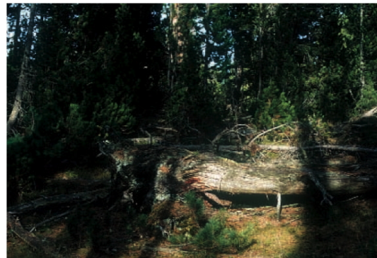
Die heutige «Wildnis» des Nationalparks (im Bild) täuscht darüber hinweg, dass dieses Gebiet früher einer intensiven Nutzung unterworfen war. Zeugen dieser Zeit sind ehemalige Kohlenmeiler, Hochhöfen, Bergbaustollen oder Triftklausen (Wehre).

Seit Anbeginn dokumentieren Forschungsergebnisse im SNP die fortschreitende Rückeroberung der Natur. So lässt sich beispielsweise belegen, dass die Artenvielfalt auf den ehemaligen Alpweiden des Nationalparks in den letzten 80 Jahren deutlich zugenommen hat. Das Beispiel des SNP zeigt uns auf eindruckliche Art und Weise, wie aus einer ehemals intensiv genutzten Landschaft ein Naturparadies werden kann. Nötig dazu waren weise Voraussicht und Geduld. Was hier gelungen ist, kann durchaus auch andernorts zum Erfolg führen. Die Gründung eines weiteren Nationalparks wäre ein erster, sehr positiver Schritt in diese Richtung. Doch auch die Ausscheidung von Ruhezeiten und die Erhaltung der traditionellen, auf einer nachhaltigen Nutzung beruhenden Bewirtschaftung tragen zur Aufwertung der alpinen Lebensräume bei.