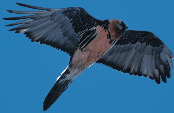
Die aktuellen Partner des Unterengadiner Paares: Rätia (links), Adultvogel unbekannter Herkunft (oben).

Es ist praktisch unmöglich, eine solche Entwicklung zeitlich vorauszusehen. Wir können versuchen, anhand einer Keimpopulation Prognosen zu stellen, indem wir den bisherigen Verlauf der Paarbildungen und Reproduktionserfolge nachvollziehen.