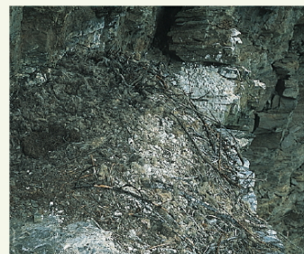
Die Horste der Paare Livigno (ganz links), Bormio (Mitte) und Zebbru (links).