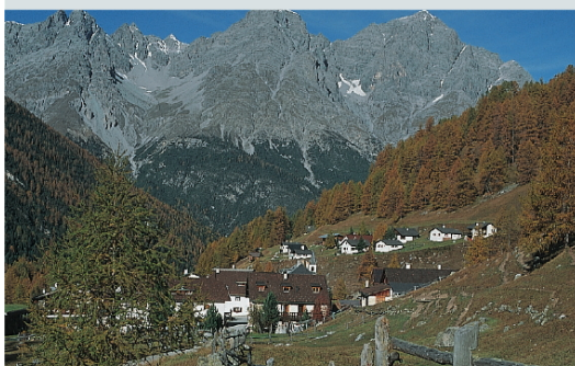
Der Weiler S-charl, Ziel der Wanderung