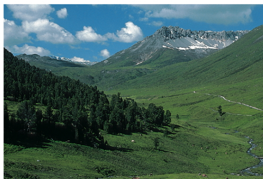
Ein Blick zurück: An der tiefsten Stelle am Horizont befinden sich die Funtanas da S-charl, rechts die Fahrstrasse zur Alp Astras und links der Arvenwald von Tamangur.

Von hier aus bestehen zwei Möglichkeiten: Links der Fahrstrasse entlang oder rechts durch den Arvenwald von Tamangur. Die zweite Variante ist die attraktivere, führt sie doch durch einen der höchstgelegenen Arvenwälder Europas. Der Wald erstreckt sich zwischen 2100 und 2300 m ü.M. Die Gründerväter des Nationalparks hätten diesen mystischen Arvenwald gerne als Teil des Nationalparks gesehen, doch blieb es bei den Plänen. Der Wald wurde als Holzreserve und als Schlechtwettereinstand für die Viehherden genutzt. Dank eines Tamangur gewidmeten Gedichts des romanischen Poeten Peider Lansel ist der sagemumwobene Arvenwald zum Symbol für die romanische Identität ge-