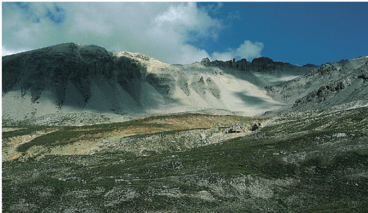
Zwischen Piz Vallatscha im Norden und Munt da la Bescha im Süden öffnet sich die Valbella unvermittelt zu einer landschaftlich reizvollen Hochebene.

Nun heisst es wieder aufbrechen, 3 Stunden Wanderung liegen noch vor uns. Der Weg führt ostwärts durch die Valbella. Der romanische Name Valbella heisst schönes Tal, was natürlich Erwartungen weckt. Der erste, eher schattige und mit Schuttrunsen durchsetzte Abschnitt der Valbella macht dem Namen noch keine Ehre. Zu wahrer Schönheit gelangt das Tal im zweiten, flacheren Teil. Die Schutthalden des Nordhangs zu unserer Rechten werden im Juli durch die gelben Blüten des Rätischen Alpen-Mohns belebt. In diesem Gebiet finden sich auch Schneehühner. Zur Linken erhebt sich