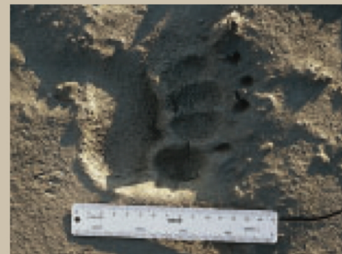
Die Länge des Trittsiegels eines Bären misst bis 20 cm (Kanada 1985).

Dank Schutzbestimmungen – in der Schweiz gilt der Braunbär seit 1962 als geschützt – zeigen verschiedene Braunbärenpopulationen Europas in den letzten Jahrzehnten einen Wiederaufschwung. Reliktpopulationen erhielten zudem Unterstützung durch Aussetzungen, so in den Pyrenäen, in Österreich und im Trentino. In diesem nahe der Schweiz gelegenen Gebiet sind in den Jahren 1999 bis 2002 zehn Bären aus Slowenien ausgesetzt worden. Die Bären haben sich dort bereits erfolgreich fortgepflanzt. Eine Einwanderung in die Schweiz ist nicht ausgeschlossen und einzelne Individuen könnten schon in nächster Zukunft auftreten. Vom ökologischen Potential her ist die Situation in der Schweiz, insbesondere in den südlichen Alpentälern, vermutlich wieder bärenfreundlicher als noch vor hundert Jahren. Andererseits hat die menschliche Besiedlungsdichte deutlich zugenommen, was das Konfliktpotential erhöht. Werden Bären vom Menschen toleriert, können sie sich bekanntlich auch in zivilisa-