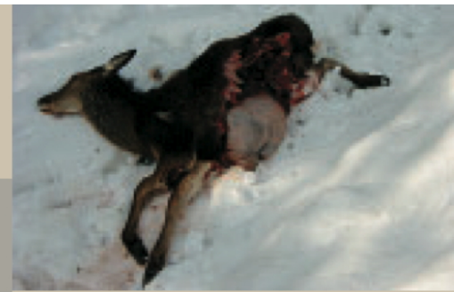
Risshirschkalb 21.12.2003, Ruschein Run rest

Trotz dieser Massnahmen erfolgten im Juni und Juli weitere 9 Angriffe. Ende August wurde der Abschuss des Wolfes verfügt und Ende September wurde dieser im Fextal erlegt. Die Bilanz: In der Schweiz riss der Wolf 5 Hirsche, 60 Schafe und 1 Ziege, in Italien 36 Schafe und 1 Ziege. Der Aufwand für Information der Bevölkerung, Jagd und Monitoring war mit ca. Fr. 100 000.– beträchtlich. Fazit: Die Kultivierung der extensiven Landwirtschaftsflächen im Bergell ist durch die Anwesenheit eines Wolfes gefährdet.