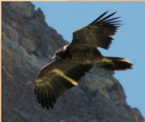
Culan wenige Tage nach seinem ersten Flug

Mit Hilfe von Satellitentechnologie werden die noch wenig bekannten Streifzüge junger Bartgeier untersucht. Ein erster Jungvogel wurde 2004 mit einem kleinen Satellitensender markiert, weitere sollen dieses Jahr im Schweizerischen Nationalpark (SNP) folgen. Die Internetseite www.bartgeier.ch informiert über das Projekt Bartgeier unterwegs und zeigt, wo die sendermarkierten Bartgeier umherstreifen.