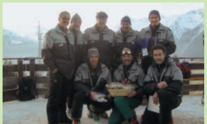
Das Parkwächterteam am Trofeo Danilo Re

Die Ausrüstung der Parkaufsicht wurde mit neuen Swarovski Kompaktfernrohren, leichteren Stativen und multifunktionalen Digitalkameras auf den neuesten Stand gebracht. Ein neuer Toyota Hilux 4x4 mit Dieselmotor, Doppelkabine und Alubrücke ersetzte den 17-jährigen VW-Transporter.