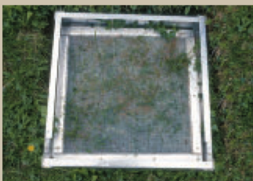
Samenkasten 50 x 50cm

Die Ergebnisse der ersten 10 Beobachtungsjahre lassen den Schluss zu, dass die natürliche Verjüngung der Wälder in der Val Trupchun durch das Schalenwild wesentlich gehemmt wird. Aber auch andere, die Verjüngung hemmende Standortfaktoren, wie Trockenheit oder verdämmende Bodenvegetation, weisen stellenweise für die Verjüngung limitierenden Charakter auf. Auf der südexponierten rechten Talseite sind solche Stellen wesentlich häufiger als auf der linken. ☾