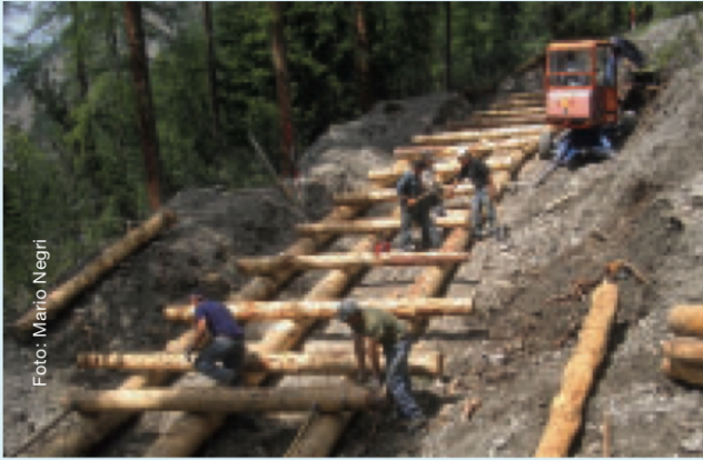
Im vergangenen Sommer bauten die Parkwächter bei der Chamanna Cluozza einen Murgangschutz.

Ende Mai konnte die neue Brücke in der Val Trupchun in Betrieb genommen werden. Das rund 8 t schwere Werk wurde in S-chanf in drei Teilen vorfabriziert und mit dem Hubschrauber auf die vorbereiteten Widerlager transportiert und zusammengebaut. Mit 24,50 m Spannweite ist sie die längste durch die Parkaufsicht angefertigte Brücke im SNP. In und um die Chamanna Cluozza standen verschiedene der Sicherheit der Bewohner dienende Projekte an. Währenddem einheimische Unternehmer den Kelleranbau mit abgetrenntem Gaslager, eine Sickerleitung und die neue Trinkwasserversorgung realisierten, bauten die Parkwächter den von amtlicher Seite geforderten Murgangschutz.