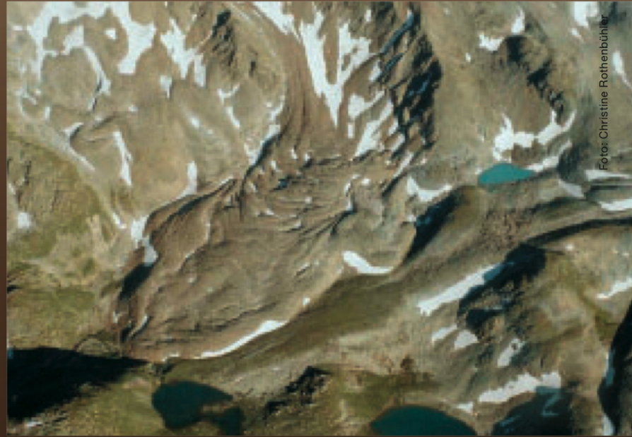
Abbildung 3: Schöne Blockgletscherformen bei den Macunseen

Serie von Bohrlöchern, von Svalbard bis in die Sierra Nevada, lieferten erste, europäisch vergleichbare Daten. Zuvor war das Bohrloch am Piz Corvatsch während 10 Jahren die einzige kontinuierliche Permafrost-Temperaturmessstelle im ganzen Alpenraum. Schliesslich begann man seit 2000 mit dem Aufbau eines landesweiten Permafrost-Messnetzes (PERMOS) – 120 Jahre nach dem Gletschermessnetz und über 50 Jahre nach dem Schneemessnetz!