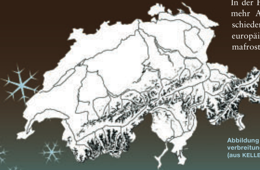
Abbildung 1: Permafrost- verbreitung in der Schweiz (aus KELLER et. al, 1998)

In der Folge schenkte die Forschung dem Permafrost mehr Aufmerksamkeit. 1996 bis 2000 waren verschiedene Schweizer Forschungsgruppen am ersten europäischen Permafrostforschungsprojekt PACE (Permafrost and Climate Change in Europe) beteiligt. Eine