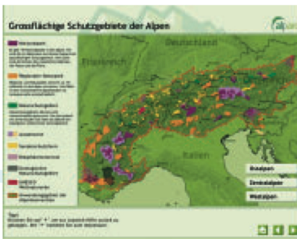
Abbildung 3 : Startseite des Touchscreens