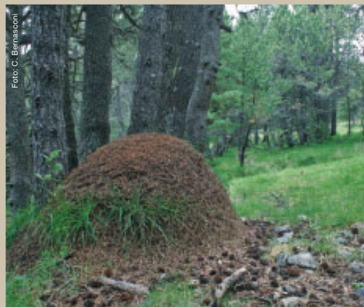
Rote Waldameisen (Arbeiterinnen)

Diese Arbeit stellt neue, zuverlässige Werkzeuge für die Identifikation der Ameisenarten zur Verfügung, welche die Überwachung dieser geschützten Arten unterstützen können. Ferner konnten wir dank unserer Arbeit eine noch nicht bekannte Waldameisenart im Schweizerischen Nationalpark nachweisen.