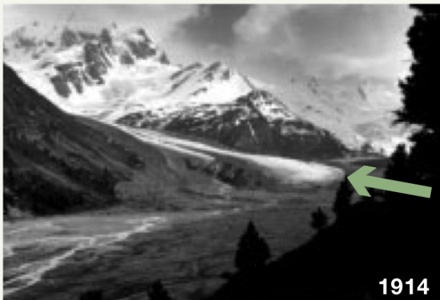
Gletscher auf dem Rückzug schaffen neue Schwemmebenen: Die Zunge des Tschier-Gletschers (Pfeil) 1914 und 2003.

«Flaschenhalspopulationen» bildeten. Diese Flaschenhalse können wichtige Verschiebungen in der genetischen Struktur der Populationen innerhalb und zwischen den Wasserbecken verursachen. Unsere Ergebnisse zeigen zudem, dass die räumliche Verteilung genetischer Strukturen Hinweise auf vergangene Vergletscherungen und glaziale Rückzugsgebiete liefern. Rasche Wechsel im Lebensraum bewirken regional die Ausbildung von vielfältigen genetischen Strukturen in unterschiedlichen Einzugsgebieten. Innerhalb von einzelnen Tälern hingegen führen sie eher zu homogenen genetischen Strukturen. Schliesslich zeigte die Beobachtung von neu gebildeten Gletscherbächen, dass einige alpine Wasserinsekten schnelle Wiederbesiedler sind und dass die Erwärmung der Bäche in tiefer gelegenen Gebieten die Besiedlung dieser Lebensräume durch Arten aus tieferen Lagen ermöglicht hat – Arten, die sonst durch die üblicherweise tiefen Temperaturen des Gletscherwassers eingeschränkt sind. Bäche sind somit ein zuverlässiger Spiegel für die vielfältigen landschaftlichen und biologischen Veränderungen im alpinen Lebensraum.