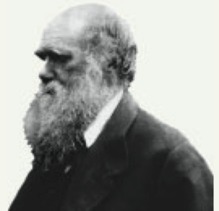
Charles Darwin (1809–1882), Begründer der Evolutionslehre