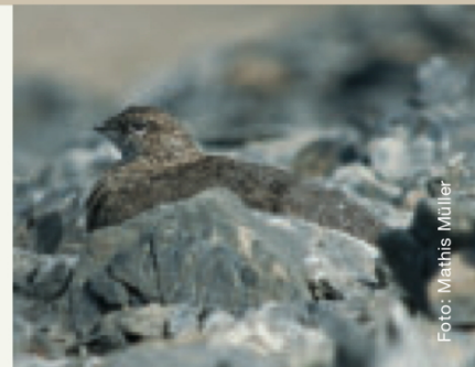
Die Bestände des Alpenschneehuhns haben sich im untersuchten Perimeter positiv entwickelt.

Feld wie auch bei der Auswertung (Kriterien für die Revierausscheidung) immer gleich und damit wiederholbar bleibt. Insgesamt zeichnen sich nach bald 15-jähriger Überwachung der Avifauna im Nationalpark stabile Verhältnisse ab. Die Bestände einzelner Arten können zwar von Jahr zu Jahr enorm schwanken, nach einer Bestandesbaisse wegen zum Beispiel lang andauernder Schneelage im Frühjahr erholen sich die Bestände meist schnell wieder. So ist die Gesamtbilanz aller Arten sehr eindrücklich: Bei den über 40 Brutvogelarten ist sowohl die Artenzahl als auch die Gesamtrevierzahl stabil, die einzelnen Arten weisen hingegen unterschiedliche Tendenzen auf. Auf dem Munt la Schera entwickelten sich die Bestände von