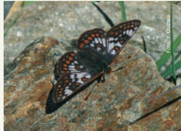
Veilchenscheckenfalter ( Euphydryas cynthia )

seit 1942 deutlich in höhere Lagen verschoben hat. So wurde zum Beispiel der Rote Würfel-Dickkopffalter Spialia sertorius rund 500 m höher angetroffen als noch 1942. Diese Resultate zeigen, dass Klimaänderungen wie die globale Erwärmung sich auch auf die Diversität der Tagfalterpopulationen auswirken können.