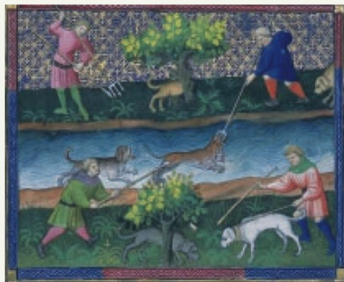
Früher galt der Fischotter als fischereifeindliches Tier.

des Fischotter in der Schweiz gründeten interessierte Personen am 21. Februar