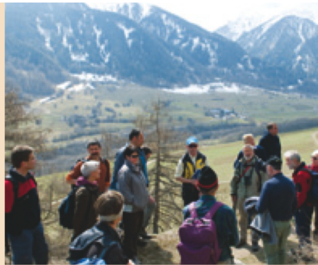
Unterwegs auf den Spuren der historischen Bewässerungskanäle

Alpen. Die Exkursion vom Samstag in die Biosfera Val Müstair widmete sich den historischen Bewässerungsanlagen, die einen sehr positiven Einfluss auf die Artenvielfalt hatten und teilweise reaktiviert werden sollen. In der Herbst-CRATSCHLA werden wir eine Zusammenfassung der Vorträge publizieren. (10)