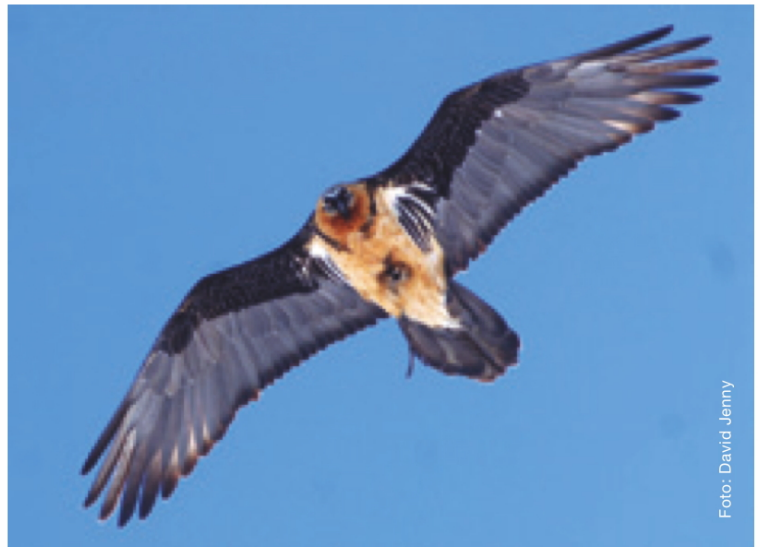
Das Bartgeierweibchen Martell fliegt nach dem Brutabbruch im Vorjahr mit einem Ast herum. Nistaktivität nach einem Misserfolg beim Brutgeschäft ist typisch.

Das Wiederansiedlungsprojekt des Bartgeiers in den Alpen kommt damit in eine neue Phase. Insgesamt reproduzieren sich im Alpenraum heute etwa 20 Paare, bei 15 sind aktuell Jungvögel geschlüpft. Damit übersteigt die Nachwuchsrate in der jungen Population die Verluste, auf weitere Freilassungen könnte daher grundsätzlich verzichtet werden. Allerdings gibt es bei so kleinen Beständen Risiken, welche die Bestandsentwicklung gefährden können: Eine geringe Erhöhung der Sterblichkeit, etwa durch Krankheiten oder Unfälle, könnte den Wachstumstrend umdrehen. Zudem ist die genetische Basis der freigelassenen Bartgeier klein, was längerfristig zu Inzuchtproblemen führen könnte. Daher werden vorderhand weitere Freilassungen stattfinden, um den positiven Trend in der Bestandsentwicklung zu konsolidieren.