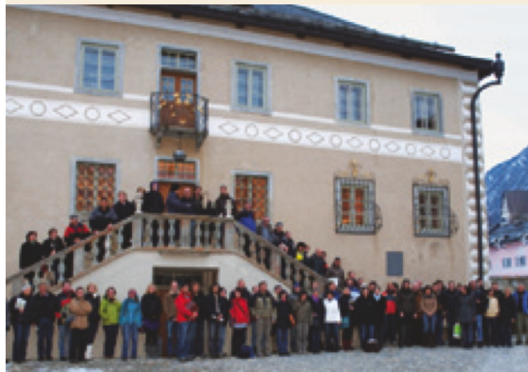
Am 10. März hatten rund 100 Personen anlässlich eines Bären-Workshops in Zernez Gelegenheit, das Thema Bär auf umfassende Weise kennen zu lernen.

Das Nationalparkzentrum Zernez ist vom 13. Mai bis 31. Oktober täglich durchgehend von 8.30 bis 18 Uhr geöffnet. Im Winter gelten reduzierte Öffnungszeiten. Details unter www.nationalpark.ch . Der Eintritt beträgt CHF 7.– für Erwachsene, CHF 3.– für Kinder, CHF 15.– für Familien und CHF 6.– pro Person in Gruppen von mehr als 10 Personen.