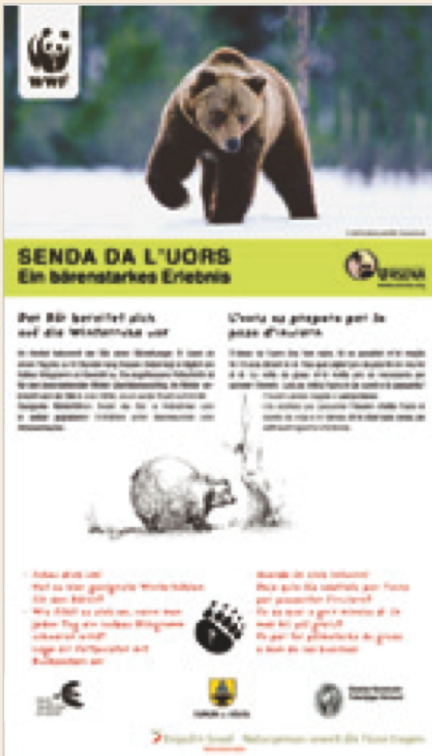
Eine der insgesamt 9 Informationstafeln