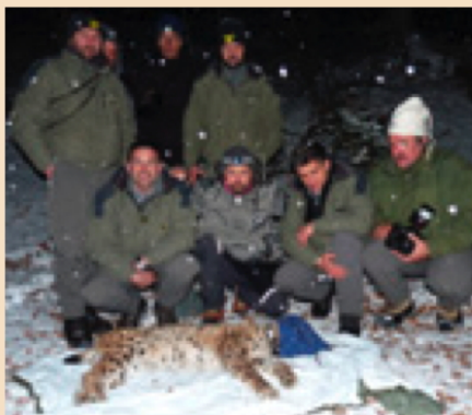
Die Tridentiner Luchsfänger mit B132

Am 10. Februar 2010 ist es den italienischen Behörden gelungen, Luchs B132 im Trentino wiederzufangen und den seit April 2009 (GPS-Teil) bzw. Oktober 2009 (VHS-Teil) ausgefallenen Telemetriesender zu ersetzen. Der am 22. Februar 2008 im Schweizerischen Nationalpark (SNP) erstmals behändigte Luchskuder war 2006 im Tössbergland (Kantone SG und ZH) geboren worden und hatte sich nach einem Aufenthalt im Bereich des SNP während des Winters 2007/2008 weiter nach Südosten abgesetzt und war bis zur Brenta-Gruppe vorgedrungen (vgl. CRATSCHLA 1/2009). Die monatelangen Bemühungen des italienischen Fangteams haben sich gelohnt: Die einmalige Geschichte dieses Luchses kann nun weiter dokumentiert werden. (ha)