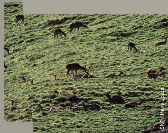
SNP / Hans Lozza