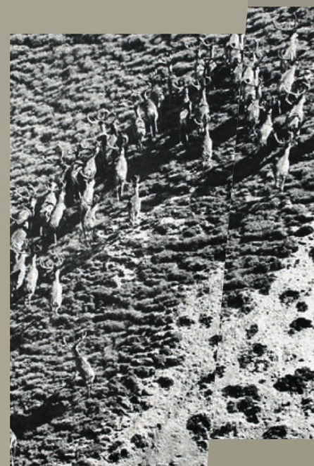
Legendäres Rothirsch-Bild von © Mic Feuerstein in den 1960er Jahren in der Val Foraz

Die Nutzung eines Sommer- und eines Wintereinstandes bringt erhebliche Vorteile. Die Unterschiede zwischen Sommer und Winter sind meist frappant und erfordern unterschiedliche Strategien. Im Herbst verlassen die meisten Rothirsche den SNP und ziehen in tiefere Lagen. Hier finden sie Nahrungsquellen vor, die sich den Sommer über von der Nutzung im letzten Winter erholt haben. Die Wanderung vom Sommer- in den Wintereinstand erfolgt in der Regel während einer Nacht. Aufzeichnungen von GPS-besenderten Hirschkühen haben gezeigt, dass diese um Mitternacht aufbrechen und am Morgen im Wintereinstand eintreffen. Dieser wird in den ersten Wochen bis zum ersten Schnee gut erkundet. Im Wintereinstand können die Tiere dann aus dem Vollen schöpfen. Ihre Artgenossen, die im SNP geblieben sind, verfolgen da eine ganz andere Strategie: Sie versuchen den Winter auf Sparflamme zu überleben.