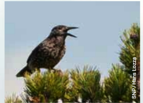
Abb. 1 Der Tannenhäher ( Nucifraga caryocatactes L.) lebt im Winter fast ausschliesslich von Arvennüsschen.

Der Rothirsch ( Cervus elaphus L.) kann zwar keinesfalls zu den Tieren gezählt werden, die mehrheitlich von Samen leben. Aber beim Äsen von grünem Pflanzenmaterial konsumiert er nebenbei auch Samenstände von Gräsern und Kräutern. Die meisten aufgenommenen Samen werden verdaut und dienen den Hirschen als willkommene Nahrung. Einige Pflanzenarten haben sich aber angepasst. Sie schützen ihre Samen mit einer