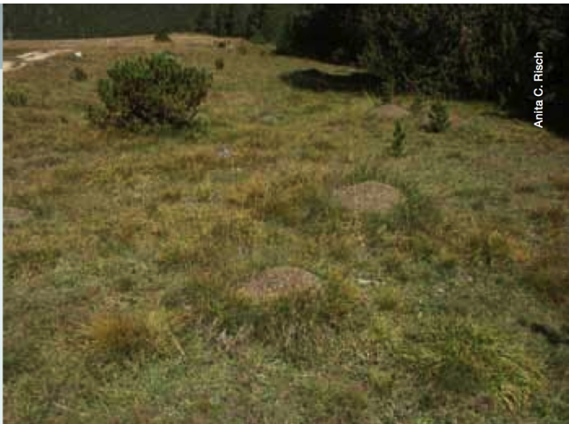
Abb. 3 Nester der Grossen Kerbameise ( Formica exsecta Nyl. ) auf Alp Stabelchod.

Martin Schütz und Anita C. Risch, WSL, CH-8903 Birmensdorf