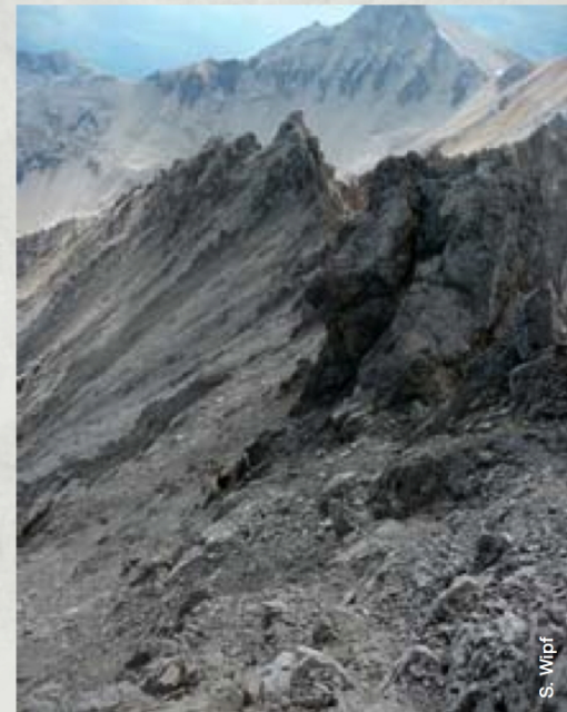
Abb. 1 Piz Tavrü (3168 m ü.M.): gut doppelt so viele Pflanzenarten als noch vor rund 100 Jahren

Insgesamt wurden auf den 14 Gipfeln (jeweils in den obersten 10 Höhenmetern) 139 Pflanzenarten gefunden, wovon 38 auf Braun-Blanquets Listen noch nicht vorkamen. 88 % der von ihm gefundenen Arten sind typisch für alpine Lebensräume, während 12 % ihre Hauptverbreitung unterhalb der Waldgrenze haben (in der Region auf ca. 2300 m ü.M.). Von den neu gefundenen Arten stammen bereits 20 % von unterhalb der Waldgrenze. Die damals gefundenen Arten haben ihre Verbreitungsgrenze heute im Durchschnitt 92 m weiter oben als früher (Abbildung 3). Diese Zahlen machen deutlich, dass im Gebiet des Nationalparks über das letzte Jahrhundert ein Höhersteigen der Arten sowie ein Einwandern von Arten aus tiefer gele-