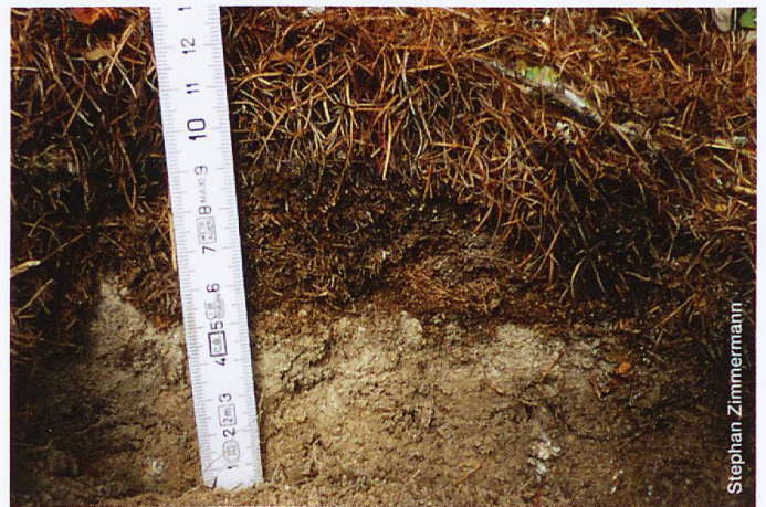
Auflage aus unzersetzter Lärchenstreu. Diese sowie die zum Teil dichte Grasvegetation wirkt verjüngungshemmend.

Grass Lea (2014) Verjüngungsökologie von Fichte und Lärche auf Extremstandorten im Münstertal. Masterarbeit ETH Zürich.