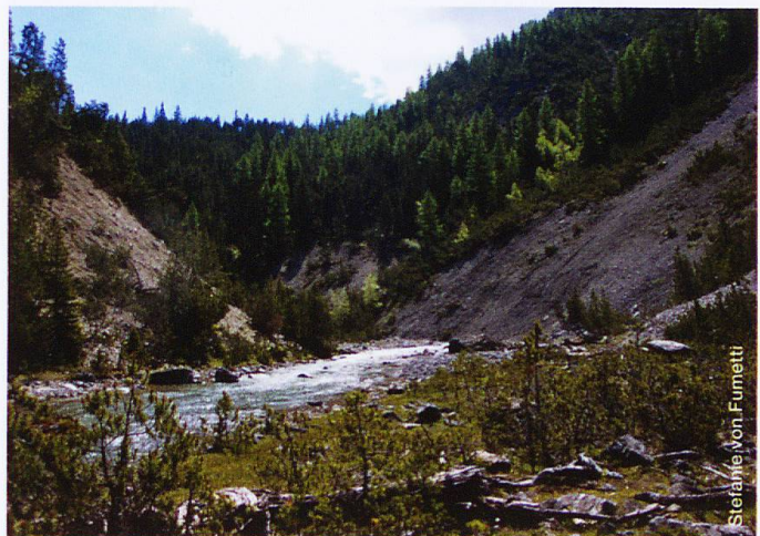
Die Quellflur am Spöl oberhalb Punt Periv

Beerli Nicolas (2014) Vegetationsanalyse des Umfeldes einiger Quellen im Schweizerischen Nationalpark. Seminararbeit, Institut für Biogeographie der Universität Basel.