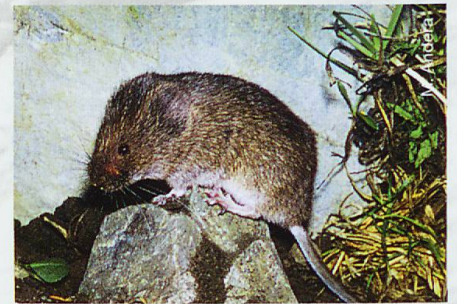
Schneemäuse sind typische Spaltenbewohner. Wir finden sie am ehesten in Geröllfeldern, wobei die Höhenlage weniger massgebend ist.

Nicht besonders reich an Arten und Individuen sind die trockenen Bergföhrenwälder des SNP. Hier findet man immer wieder die Rötelmaus, die in der Schweiz praktisch alle Waldgesellschaften besiedelt. Regelmässig, aber nicht häufig, ist die Alpenwaldmaus anzutreffen, eine Kleinsäugerart, die erst im Jahre 1989 erstmals beschrieben wurde und neben dem Alpensteinbock die einzige endemische Säugerart der Alpen ist, also nur hier vorkommt. Seltener sind ihre Schwesterarten, die Gelbhalsmaus und die Waldmaus. Wälder mit felsigen Partien sind der typische Lebensraum des Gartenschläfers.