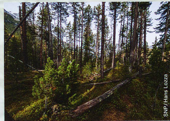
Bergföhrenwälder wie hier bei Plan da l'Acqua halten Kleinsäugetieren einen spärlichen Lebensraum bereit.