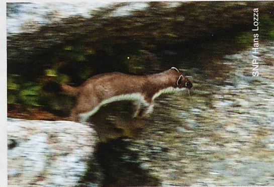
SNP / Hans Lozza