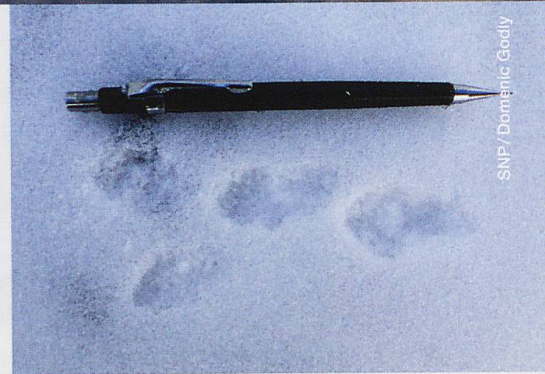
SNP / Domenic Godly

Anders ist die Situation beim Hermelin. Die Tragzeit beträgt nicht 34 bis 37 Tage wie beim Mauswiesel, sondern 9 bis 10 Monate, da sich die befruchtete Eizelle erst nach einer langen Keimruhe in die Gebärmutter einnistet und sich dann weiter entwickelt. So ist nur ein Wurf pro Jahr möglich, allerdings mit 4 bis 12 Jungen. Eine ganz spezielle Situation bei den Hermelinen ist die Begattung von weiblichen Jungtieren. Ein Hermelinmännchen kann nicht nur die Mutter, sondern auch alle weiblichen Jungtiere im Säuglingsalter begatten. Bei ihnen wird sich die befruchtete Eizelle erst nach dem Erwachsenwerden in die Gebärmutter einnisten. Wenn junge weibliche Hermeline in neue Gebiete abwandern, so sind sie bereits trächtig und können ohne Männchen eine Kolonie gründen. Die mittlere Lebenserwartung beträgt rund eineinhalb Jahre. Einzelne Tiere können auch im Freiland deutlich älter werden.