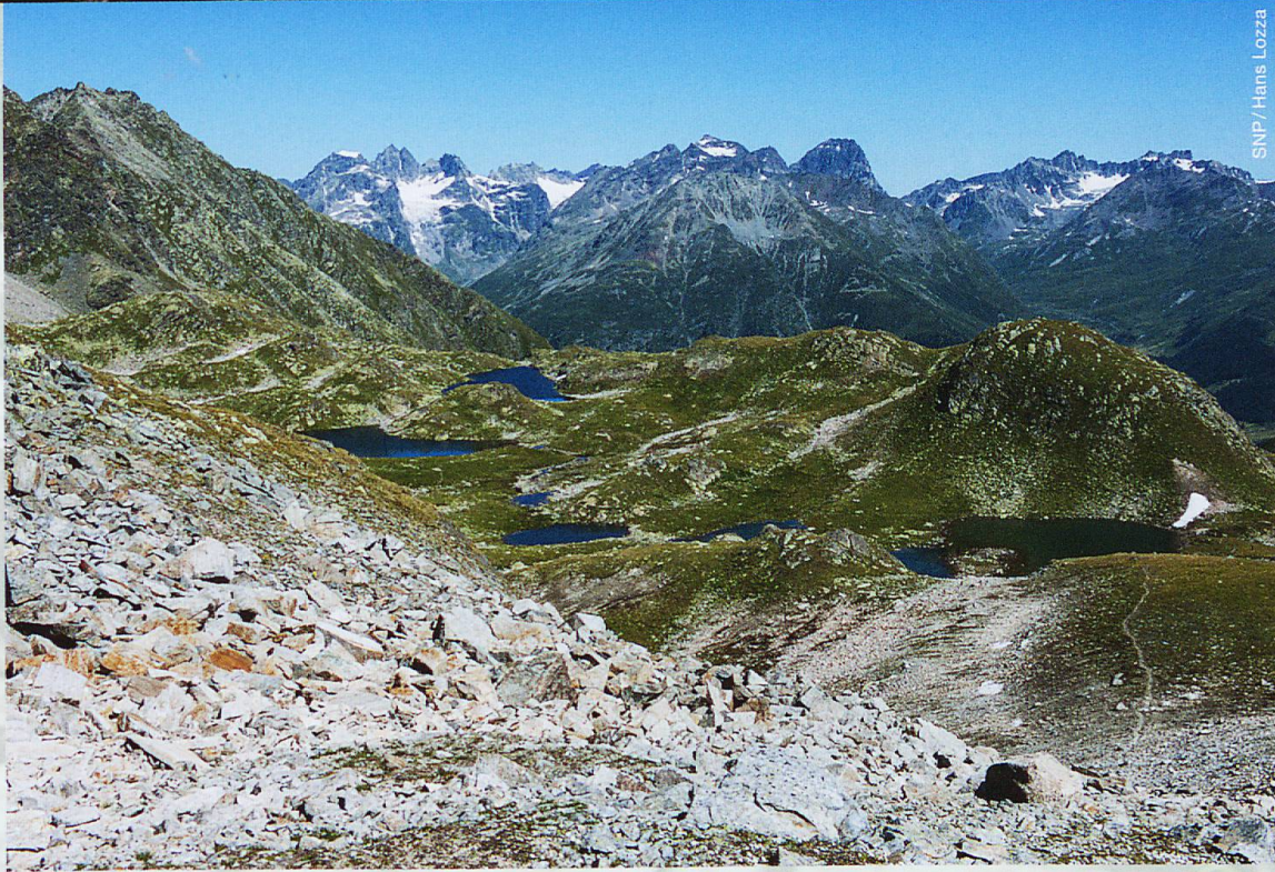
Die Geröllfelder auf Macun bieten Schneemäusen beste Lebensbedingungen.