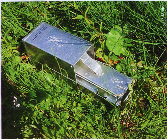
Eine Lebendfalle Typ Longworth mit einem Apfelschnitz und etwas Hackfleisch

ist. So fing ich etwa in höher gelegenen Gebieten der Val Stabelchod mit 200 Fallen in 2 Nächten gerade 8 Mäuse in 4 Arten. Mit dem gleichen Aufwand konnte ich in Chasuot und Clüs bei Zernez 130 Kleinsäuger in 12 Arten nachweisen. Dieser Fangplatz umfasste sehr unterschiedliche Lebensräume: die Auen am Inn und an Bächen, Blockhalden, Wald- und Wiesengebiete sowie einen Bauernhof.