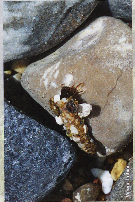
Larve der Köcherfliege Apatania helvetica

Verbreitungskarte von Apatania helvetica in der Schweiz (Datenbank CSCF); gelb markiert der Neufund im Nationalpark. Rote Symbole bezeichnen Funde nach 1990, orange vor 1990.