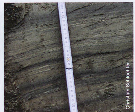
Abb. 2 Seeablagerungen (Ss) im Detail

Christian Schlüchter, Institut für Geologie der Universität Bern Franziska Nyffenegger, Geozentrum, Berner Fachhochschule, Burgdorf