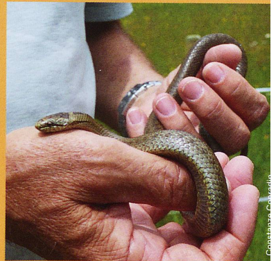
GEO-TAG der Artenvielfalt 2015: Schlingnatter

für das Münstertal wurden bei den Pflanzen gemacht. Die Pfeilkresse Cardaria draba sowie die Rosmarinblättrige Weide Salix rosmariniifolia wurden am GEO-Tag erstmals nachgewiesen. Matt Braunwalder konnte das Vorkommen der Skorpionart Euscorpis (Alpiscorpis) germanus (KOCH, 1837) bestätigen. Das Verbreitungsgebiet der Art beschränkt sich auf die östlichen Alpen. In der Schweiz wurde sie bisher nur im Münstertal nachgewiesen. Ein Rahmenprogramm lenkte den Blick von Gästen und Bevölkerung auf die Biodiversität. Auf diversen Exkursionen konnte der Vielfalt im Gebiet nachgespürt werden. (Constanze Conradin, Projektleiterin Forschung der BIOSFERA Val Müstair)