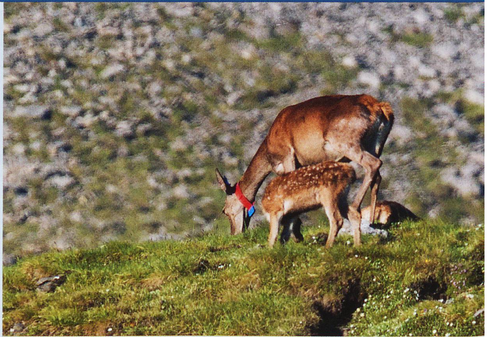
Markierte Hirschkuh mit Kalb oberhalb Plan dals Poms

Aus dem Gebiet Ramosch hingegen wanderte ein Stier nach Nauders ab. Ein zweiter ging bis auf die Alp Zenzina und zuhinterst in die Val Tasna, ehe er nach Vnà zurückkehrte, um schliesslich von der Val Chöglias ins Fimbatal überzusetzen. Die Vermutung, dass Hirsche aus Scuol den Sommer im Gebiet der Val S-charl–Mingèr–Tavrü verbringen, liess sich bereits bestätigen. Am 1. Juli konnten unterhalb des Murtersattels bei Plan dals Poms zwei Hirschkühe fotografiert werden. Beide wurden in Ftan innerhalb weniger Meter mit Sichtmarkierungen versehen. Es macht den Anschein, als ob sie immer noch zusammen unterwegs sind. Mit dieser Beobachtung lassen sich die Erkenntnisse von Blankenhorn et al. (1979) ergänzen (S. 151 im Atlas des Schweizerischen Nationalparks). Sie erfassten damals noch keinen Hirsch, der von Ftan nach Murter gewandert ist. (tr)