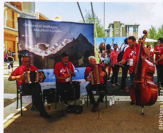
Orizzonti di Montagne vor dem Padiglione Svizzero

1. bis 5. Oktober werden der SNP und seine Partner ein zweites Zeitfenster nutzen, wiederum im Auditorium neben dem Restaurant des Padiglione Svizzero.