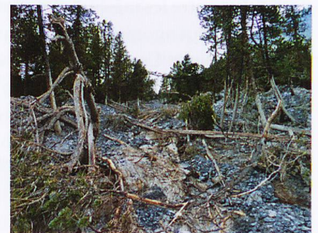
Abb. 2 Folgen der Murgänge in der Val Mingèr