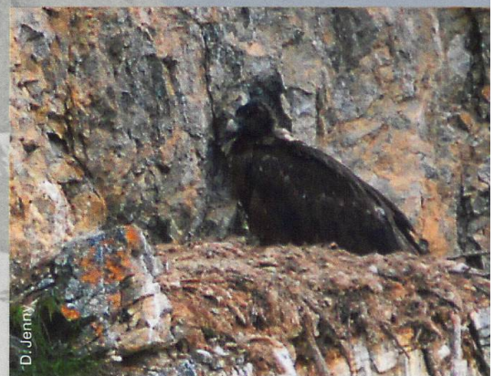
Abb. 5 Ausgewachsener Jungvogel in der Val Tantermozza am 18. Juni 2016 kurz vor dem Ausfliegen