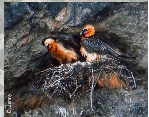
Abb. 1 Bartgeiern macht die Winterkälte kaum etwas aus, sie profitieren sogar vom erhöhten Fallwild-Angebot.