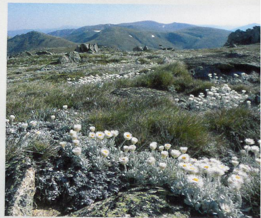
Abb. 2.3 Alpine Pflanzengesellschaft der Australischen Berggipfel mit Leucochrysum albicans

Wesentliche Kriterien für die weltweite Umsetzbarkeit waren Vergleichbarkeit und Einfachheit der Feldaufnahmen, deren Durchführung