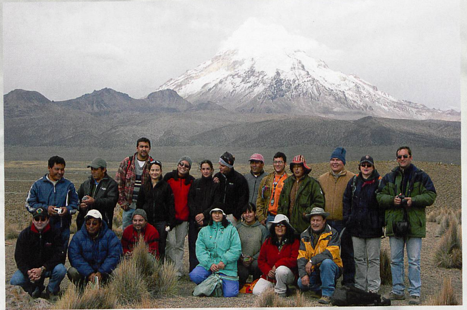
Abb. 2.4 Trainingsworkshop in den bolivianischen Anden

auch mit geringen finanziellen Mitteln machbar sein muss. Der Großteil der Gebirgspflanzen ist langsamwüchsig, langlebig und überdauert kurzfristige ungünstige Witterungsbedingungen. Für länger anhaltende Klimatrends sind alpine Arten und ihre Zusammensetzung am natürlichen Standort jedoch Indikatoren der ökologischen Klimawandelfolgen. Die Reaktion der Pflanzenarten, etwa eine Neubesiedlung, verstärktes Wachstum, Rückgang oder Verschwinden, ist speziell im Hochgebirge Ausdruck multipler Klimaeinflüsse, die über Jahre integriert werden. Dadurch ist kein aufwändiges, hochfrequentes Messsystem nötig. Intervalle von 5 bis 10 Jahren sind für die Wiederholungsuntersuchungen durchaus ausreichend. Zudem werden laufend Temperaturmessungen in der oberen Bodenschicht durchgeführt.