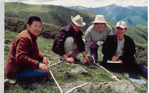
Abb. 2.1 GLORIA-Monitoringfläche, Sichuan, China

Mit dem Weltgipfel der Vereinten Nationen in Rio de Janeiro 1992 wurden global relevante Konventionen zum Umwelt-, Arten- und Klimaschutz verabschiedet, die auch der ökologischen Forschung in Gebirgsräumen Vorschub leisteten. Im Zuge der Entwicklung internationaler Forschungsstrategien zur Biodiversität in Hochgebirgen (MESSERLI & IVES 1997) wurde der dringliche Bedarf für Modellstudien, experimentelle Forschung und Langzeit-Monitoring zur Erkennung kritischer Veränderungen wahrgenommen. Den Impuls zur Schaffung eines Monitoring-Netzwerks für die Hochgebirge der Erde setzte dann ein Workshop des Internationalen Geosphären-Biosphären-Programms in Kathmandu im Jahr 1996.