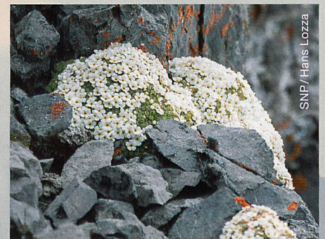
Abb. 3.2 Schweizer Mannsschild Androsace helvetica auf dem Piz Foraz (3092 m ü.M.), angeschmiegt an den Fels und geschützt vor Wind und Wetter

Insbesondere auf den tiefer gelegenen, artenreichen Gipfeln waren alle Sinne für die subtilen Merkmale zur Pflanzenbestimmung gefordert. Ist der Blattrand dieser Segge rau oder glatt? Riecht das zerriebene Blatt dieser Liebstöckel-Art nach Sellerie oder nach nichts? Sind die winzigen