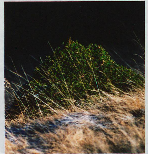
Diese Fichte wurde durch Verbiss gestutzt.