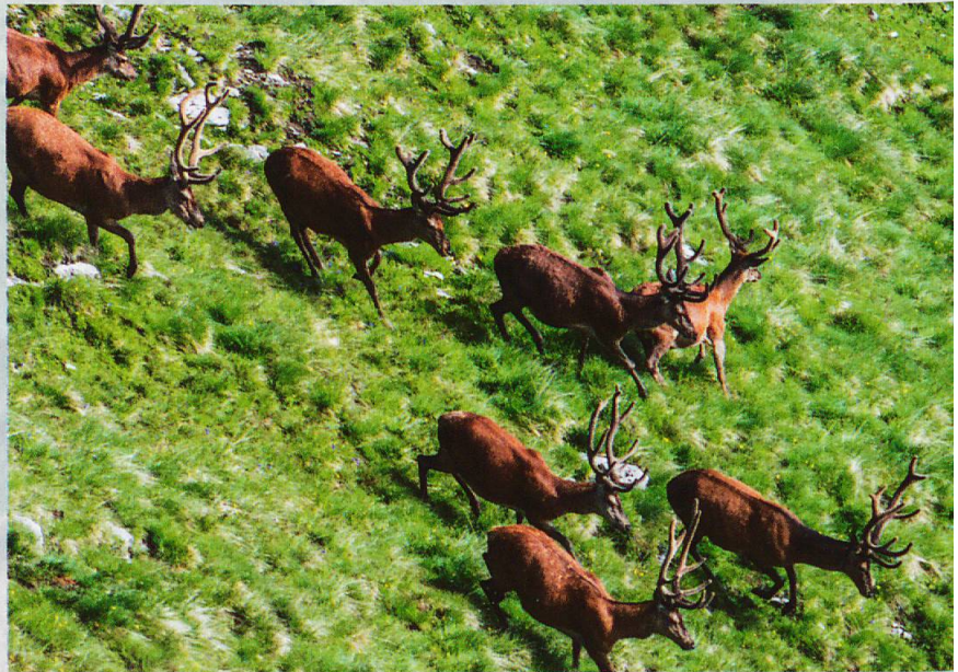
Serengeti der Alpen?

Im Jahr 1914 konnten die Gründerväter des Schweizerischen Nationalparks noch nicht erahnen, welche zentrale Rolle der Rothirsch einst in diesem Gebiet spielen würde. Die Art war zuvor im Engadin und weiten Teilen Graubündens durch Überbejagung verschwunden. Nach sehr langer Abwesenheit besiedelte er erst im Laufe der 1920er-Jahre – ausgehend vom Rätikon und via Prättigau – den SNP und dessen Umgebung wieder in grösserer Stückzahl (HALLER 2002).