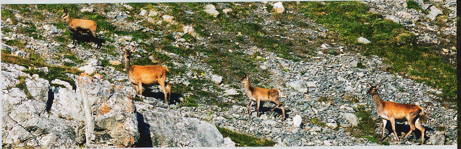
Rothirsch, Gämse und Steinbock nutzen den gleichen Lebensraum.