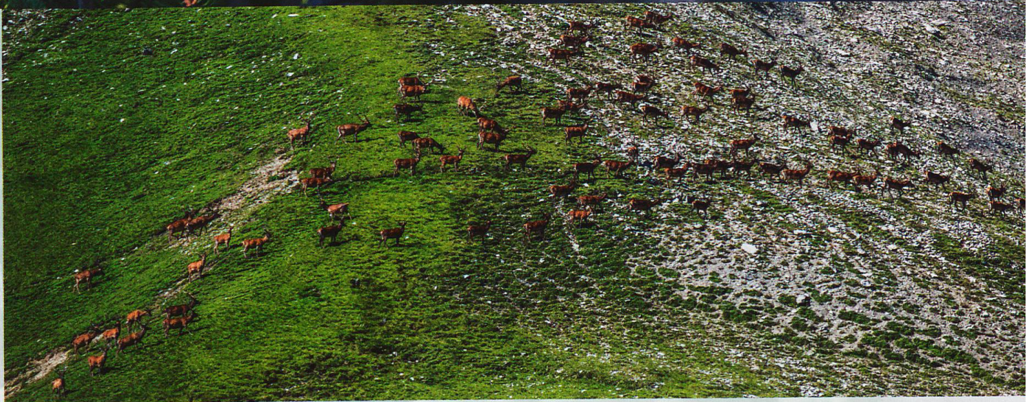
Im Sommer leben in der hinteren Val Trupchun Hirschherden mit bis zu 500 Tieren.