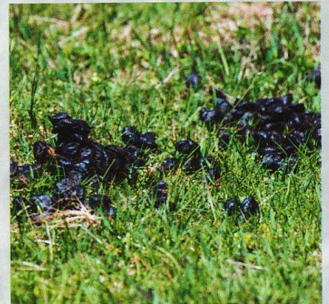
Für den Dünger sorgen die Rothirsche gleich selbst.

Der selektive Verbiss bestimmter Pflanzenarten führt aber auch dazu, dass sich vermehrt Arten ausbreiten, die von den Tieren entweder gemieden werden oder sich durch ihre Wuchsform dem Verbiss entziehen können (SCHÜTZ et al. 2003). Dazu gehören vor allem Kräuter, die Stacheln, Dornen oder giftige Sekundärstoffe bilden oder sehr niedrig über dem Boden wachsen, sodass sie schwer abgeweidet werden können. Das Zusammenspiel all dieser Mechanismen hat dazu geführt, dass sich innerhalb der Dauerbeobachtungsflächen auf den intensiv beästen Hirschweiden im Park zwischen den Jahren 1917 und 1999 die Artenvielfalt im Schnitt verdoppelt hat (SCHÜTZ et al. 2003). Die Hirsche beeinflussen somit durch ihre Nahrungswahl nachhaltig die Konkurrenzverhältnisse zwischen den Wiesenpflanzen und damit