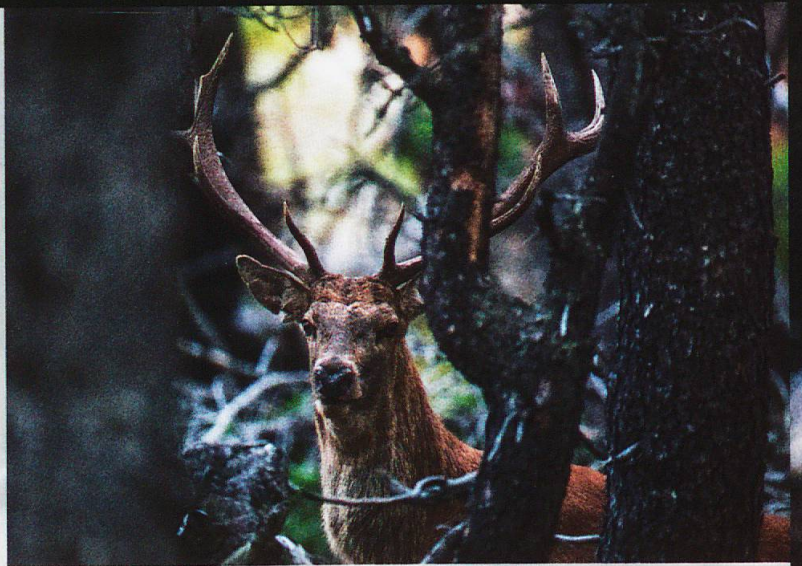
Der Rothirsch: Symbol für Kraft und Unsterblichkeit

Für die imposante Hirschbrunft wandern an Wochenenden im September täglich bis zu 1000 Besucher in die Val Trupchun. Hier kann man dieses Spektakel am besten geniessen. Eindrücklich ist auch eine Übernachtung in der Chamanna Cluozza, wo die Gäste vom Röhren der Hirsche in den Schlaf begleitet werden. Wer nicht so weit wandern möchte, kann die Hirschbrunft auch beim Hotel Il Fuorn erleben. €