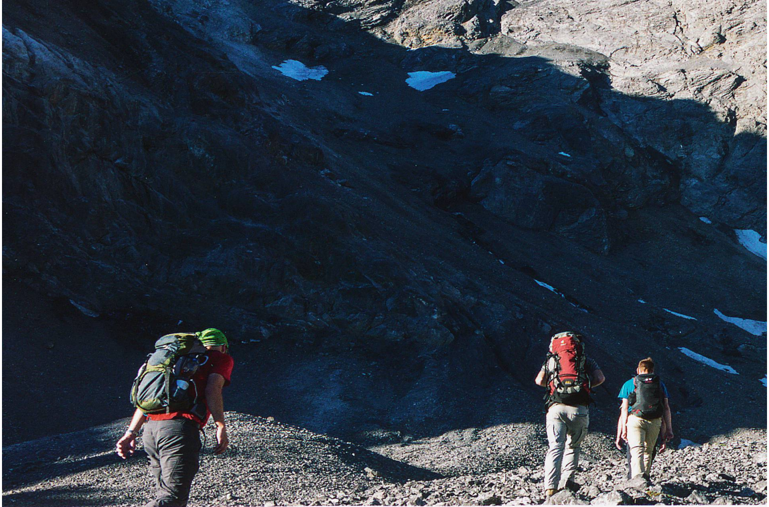
Die Route auf den Piz Quattervals führt in den Sattel rechts des Gipfels. Im Frühjahr kann auch durch die schattige und schneebedeckte Nordostflanke aufgestiegen werden.