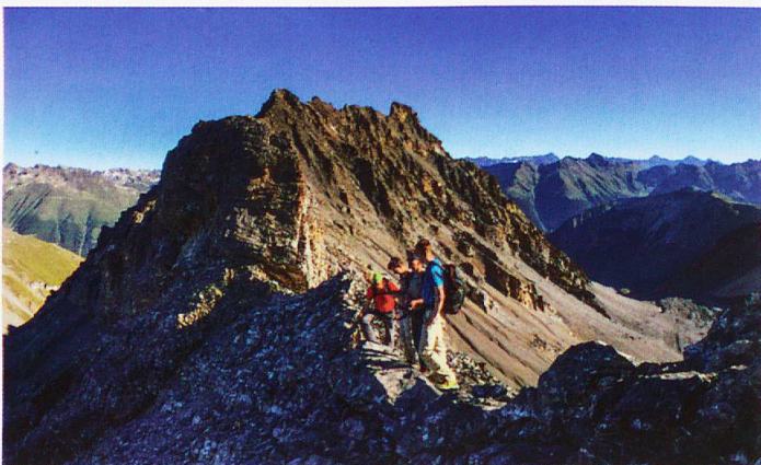
Auf dem Grat zwischen Piz Tantermozza (hinten) und Piz Quattervals

Wer auf dem Dach des Nationalparks eine Stunde bei schönstem Sonnenschein verbringen darf, erlebt unvergessliche Momente. Doch wir alle wissen: Der Abstieg wartet auf uns. Nachdem wir unsere Energiespeicher ordentlich mit Salsiz, Roggenbrot und Nusstorte aufgefüllt haben, verabschieden wir uns von diesem wunderbaren Ort. Jetzt erfordert jeder Schritt unsere ganze Aufmerksamkeit und Stöcke können hier gute Dienste leisten. Wir verlassen den Gipfelbereich und gelangen wieder zurück in die Valletta. Nach gut 2 Stunden haben wir das Größte hinter uns gebracht. Beim Gegenaufstieg zur Chamanna Cluozza macht sich die Vorfreude auf einen grossen Durstlöcher breit – unsere Kehlen sind von Wind, Sonne und Staub ausgetrocknet und lechzen nach Flüssigkeit. Doch wie auch immer: Die körperlichen Strapazen haben sich mehr als gelohnt. ☺