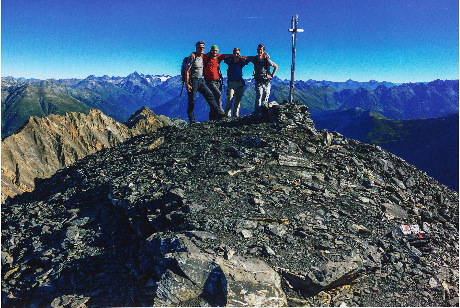
4 «Könige» auf dem Dach des Nationalparks

lässt es sich nicht nehmen, immer wieder Gäste auf den Berg zu begleiten. Mehr zu den buchbaren Touren erfahren Sie am Ende dieses Beitrags.