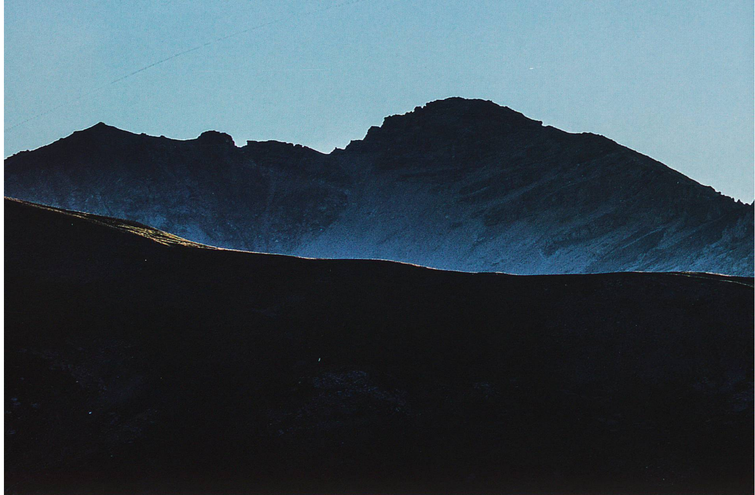
Erstes Licht über den Dolomitbergen im Osten. Rechts im Vordergrund der Murtersattel

sich zu seltsam klopfenden Geräuschen und mündet schliesslich in ein veritables Rumpeln. Besonders aktiv ist es in den frühen Morgenstunden. Tatsächlich, Holzhäuser haben so ihre Tücken. Doch wer den Piz Quattervals besteigen möchte, sollte ohnehin früh aufstehen, auch wenn die Mitbewohner wenig Freude am «Hüttengeist» haben werden. Doch wer Ja zur Hüttenromantik gesagt hat, sollte auch keine Angst vor dem knarrenden Hüttengeist haben.