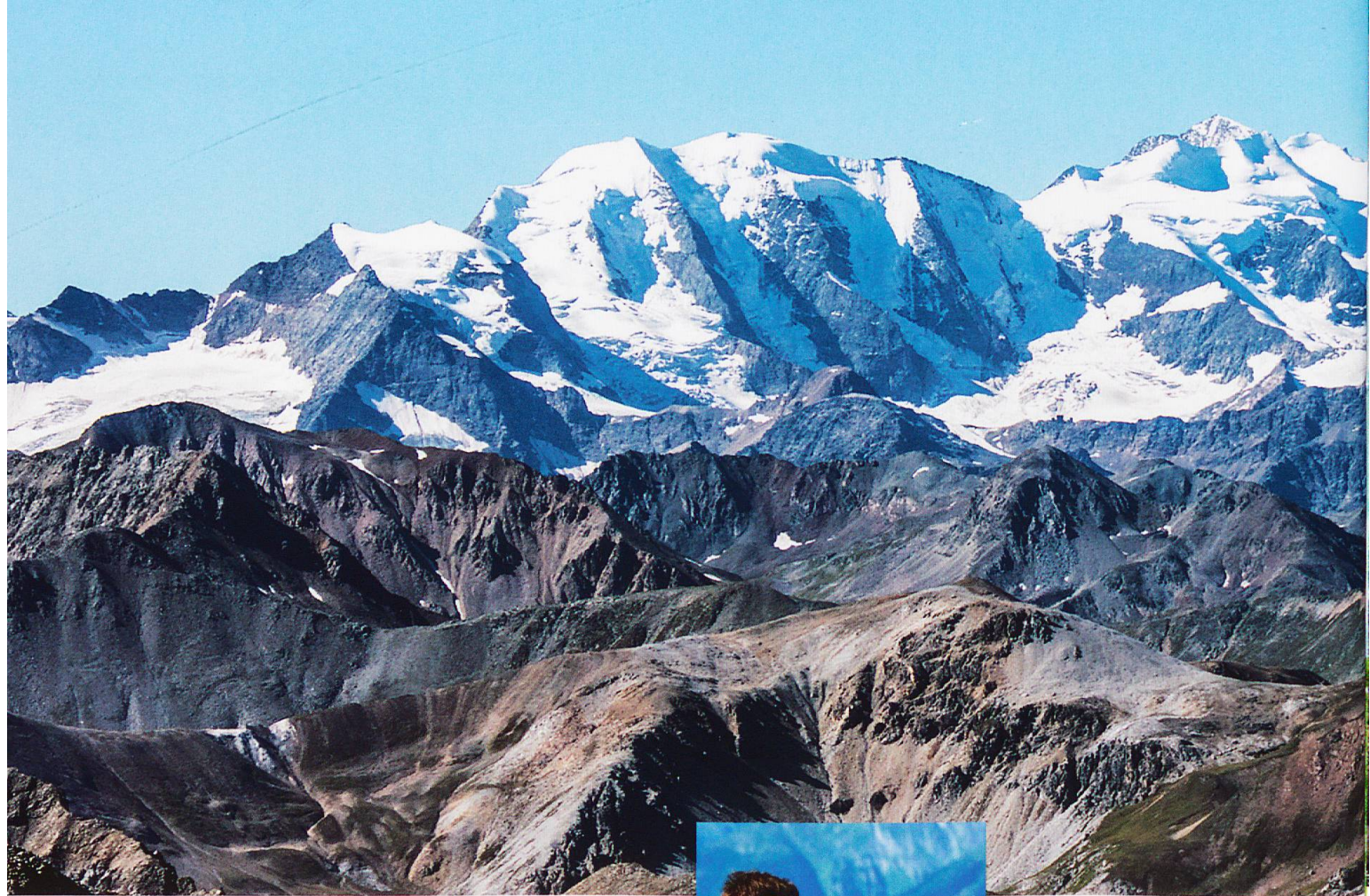
Blick zum Bernina-Massiv: Piz Palü, Bellavista, Piz Bernina, Piz Morteratsch (v.l.)