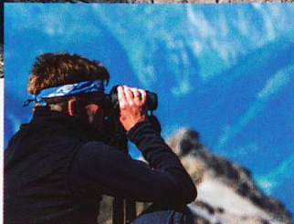
Aussicht vom Feinsten

erste grosse Schweizer Kartenwerk. Coaz, der Bürger von S-chanf war, wurde später erster Eidgenössischer Forstinspektor und hat bei der Gründung des SNP eine wichtige Rolle gespielt. Er blieb bis zu seinem 93. Lebensjahr im Amt, weil er die Realisierung des ersten Nationalparks der Alpen persönlich sicherstellen wollte.