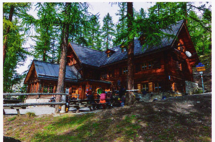
Der Ausgangspunkt: Die Chamanna Cluozza

terkunft für die Parkwächter und Gäste zu bauen. Nach diversen Umbauten und Erweiterungen bietet die Hütte nach über 100 Jahren 63 Plätze in Mehrbettzimmern und Gruppenlagern. Dass sich vor der Hütte Fuchs und Hase gute Nacht sagen, vermag nicht weiter zu überraschen. Weniger bekannt, aber umso penetranter, ist jedoch ein anderes Wesen. Immer dann, wenn es mucksmäuschenstill geworden ist im Haus, macht es sich bemerkbar: Ein vorerst leises Knarren steigert