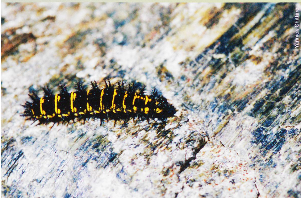
Abb. 3 ...und weichen auf der Suche nach geeigneten Entwicklungsbedingungen für ihre Raupen in höher gelegene Gebiete aus.

PADFIELD, G., V. BAUDRAZ, M. BAUDRAZ & Y. CHITTARO (2014): Le Cardinal Argynnis pandora (Denis & Schiffermüller, 1775) s'est-il établi en Suisse (Lepidoptera, Nymphalidae)? Entomo Helvetica 7: 99–111.