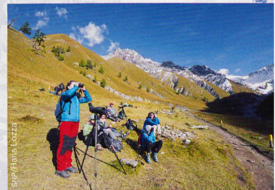
Abb. 3 Citizen scientists werden Teil der Forschung im SNP.

Norman Backhaus, Geographisches Institut, Universität Zürich