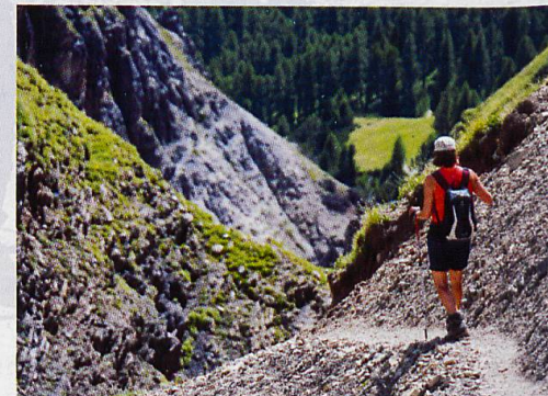
Abb. 1 Traditionelle Aneignung des SNP durch eine Wanderin. Geht dies auch virtuell?

Neben einer möglichen grösseren Nachfrage des bestehenden Angebots könnte für bestimmte Personengruppen eine digitale Aneignung über einen virtuellen Besuch attraktiv sein. Dies könnte auf unterschiedliche Weise erfolgen. Eine Reihe qualitativ hochstehender und gut verteilter Webcams könnte eine (quasi-)live-Situation ins Wohnzimmer oder auf das Smartphone von Pendlerinnen und Pendlern bringen. Damit wäre die Möglichkeit gegeben, auch gewisse abgelegene Gebiete, die nicht begangen werden dürfen, den virtuellen Besuchern und Besucherinnen näherzubringen. Technisch wäre dies allerdings anspruchsvoll, da nicht nur die Stromversorgung, sondern auch die Wartung der Kameras Kosten verursachen (je nach technischer Entwicklung könnten diese Kosten in Zukunft markant sinken). Um das Potenzial eines solchen Zugangs zu testen, könnte mit wenigen Webcams an (für die Wartung) gut zu-