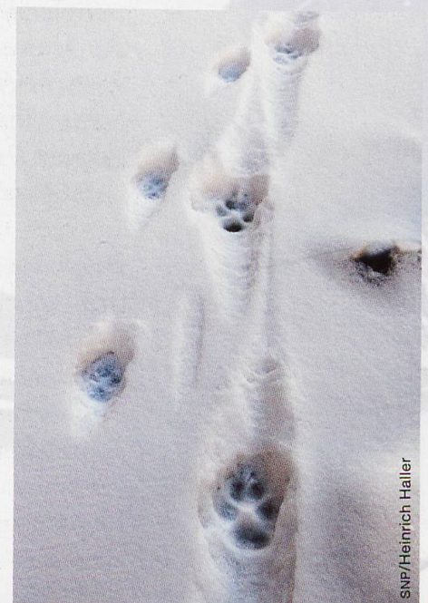
Abb. 1 Der erste gesicherte Nachweis eines Wolfs im SNP: Wolfsspur (rechts, links Rotfuchs) in der Val da Stabelchod, 24. Dezember 2016

Wie oben angedeutet, hat im Leben der grossen Säugetiere des Nationalparks bis anhin ein grundlegendes Phänomen weitgehend gefehlt, nämlich der Jagddruck durch Prädatoren. Die in der Natur fundamentale Wechselwirkung zwischen Räuber und Beute hat erst zu jenen Anpassungen geführt, die wir gerade bei Huftieren bewundern, zum Beispiel die Kletterfähigkeit des Steinbocks oder die hohen Nachwuchsraten von Rothirsch und Reh. Von daher liegt es auf der Hand, dass die Rückkehr vorab der beiden eigentlichen Beutegreifer Wolf und Luchs zu Entwicklungsprozessen führt, die für den SNP von grundlegender Bedeutung sind. Mehr noch, unser Nationalpark wurde ja gerade deswegen geschaffen, um natürliche Wirkungsweisen zu ermöglichen und diese zu erforschen.