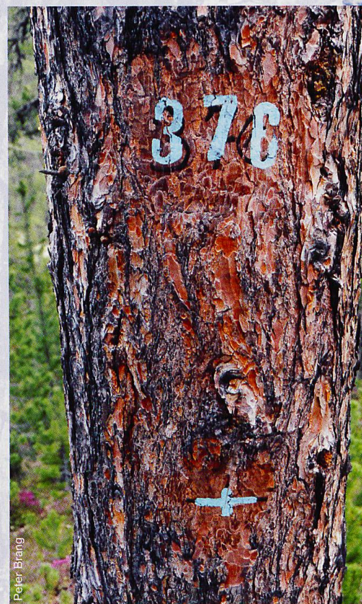
Abb. 4 In 18 Dauerflächen im Nationalpark wird seit Jahrzehnten die Entwicklung der Waldbestände erforscht. Hier eine beobachtete Bergföhre.