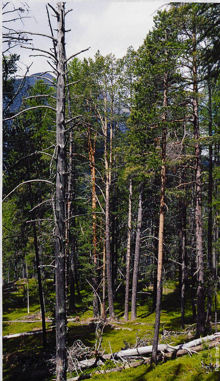
Abb. 2 Waldföhren im Park profitieren vom Klimawandel.