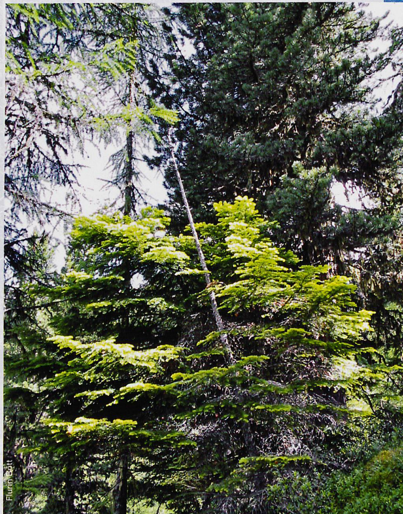
Abb. 1 Von selbst angesamte Weiss-tanne in der Val Morain bei Sta. Maria

Die Erwärmung begünstigt im Nationalpark die Fichte und, vor allem wenn der Niederschlag abnimmt, die Waldföhre (Abbildung 2). Beide Arten sind im Park bereits präsent. Erwärmung und Trockenheit fördern aber auch Waldbrände. Die jetzige Strategie – jeden Brand zu löschen, aber das beim Absterben von Bäumen entstehende Brandgut liegen lassen – dürfte die Brandgutmenge stetig ansteigen lassen und über kurz oder lang zu kaum mehr kontrollierbaren Bränden führen, wie Erfahrungen aus Nordamerika zeigen.