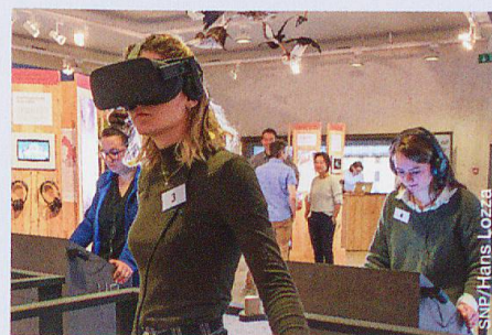
Eine Schulklasse aus Samedan beim Besuch der Expedition 2 Grad

gang und Klimawandel, zu erreichen. Die ausführlichen Ergebnisse der Evaluation werden voraussichtlich im kommenden Frühjahr publiziert. (mi) www.expedition2grad.ch