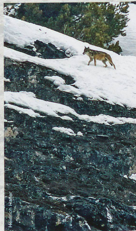
Abb. 2 Einzelner Wolf (offenbar F18) im steilen Gelände oberhalb Il Fuorn, 11. März 2018

In Mittel- und Süditalien überlebten Anfang der 1970er-Jahre rund 100 Wölfe. 1976 wurde die Art landesweit ohne Einschränkung geschützt. Verbunden mit einer verbesserten Nahrungsgrundlage auf der Basis markant erhöhter Bestände wild lebender Huftiere setzte eine dynamische Populationsentwicklung und rasche Ausbreitung ein. Spätestens seit 1983 gehört das Gebiet nördlich von Genua wieder zum ständigen Wolfsareal, 1992 wurden 2 Wölfe im Nationalpark Mercantour in den französischen Seealpen gesichtet, und im Verlauf der folgenden Jahre etablierte sich im südlichsten Abschnitt der Alpen ein Rudel nach dem anderen. Bereits 2012 war ein grosser Teil der französisch-italienischen Westalpen wieder besiedelt; man zählte 33 Wolfsrudel und 5 Wolfspaare.