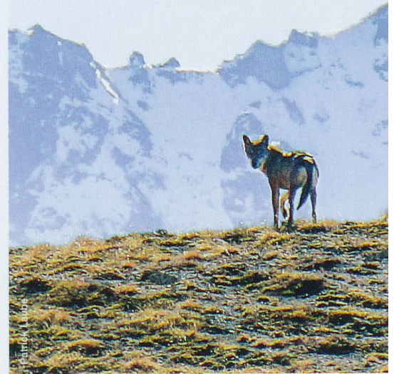
Abb. 3 Einzelner Wolf (offenbar F18) im alpinen Gelände am Munt la Schera, 15. Oktober 2017